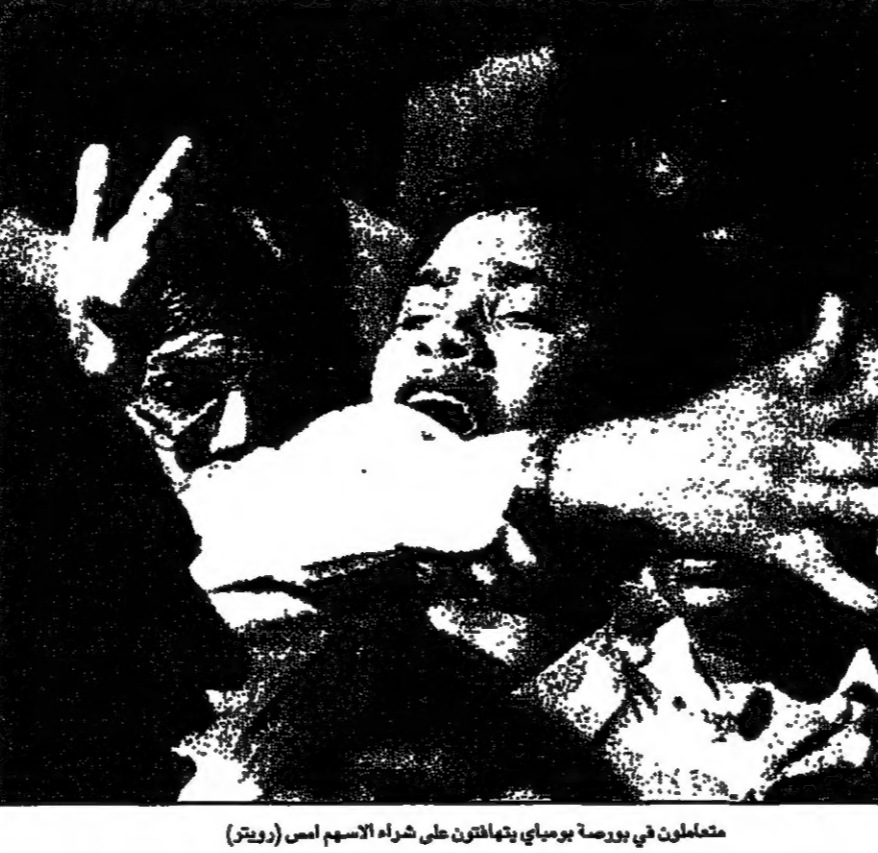
متعاملون في بورصة برومباي يتناقضون على شراء الاسهم اس

وقال ممثلون باسم وزارة السياحة السورية ان الوزارة تدرس تأسيس بنك للمعلومات السياحية يسمح كافة القطاعات التي تهم السائح.